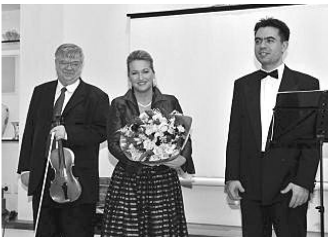
Budapest város jeles múvészei

Na druženju koje je uslijedilo poslije koncerta, izrečeno je da će Budimpešta i drugom prigodom osigurati gostovanje poznatih umjetnika u MKD Ady Endre