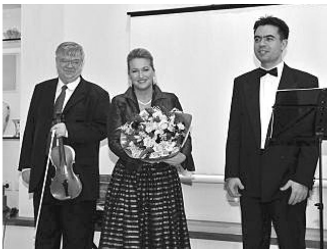
Budapest város jeles művészei

A jelenlévőket beavatta sok ismeretlen intim családi titokba és történelmi érdekességbe, mind például az hogy Monarchiából Kirgisztánban szervezett tömeges kivándorlások is voltak. Megdöbentű volt halgatni, milyen reményekkel indultak útnak az emberek és milyen kiábrándulásban volt ott részük.